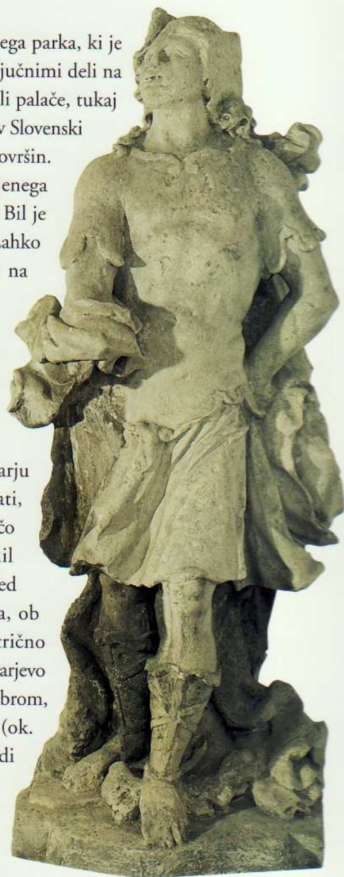
Kip Hermesa (Merkurja) v naravni velikosti je bil že konec 17. stoletja del kiparskega okrasja grajskega parka.