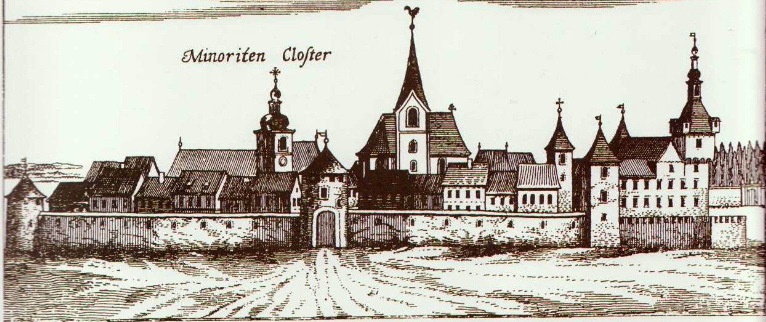
Slovenska Bistrica, pogled s severne strani, pred letom 1681. Grad se kaže še v svojih srednjeveških oblikah, a upodobitvi ne kaže povsem zaupati. (Po G. M. Vischerju, 1681)

V razgibanih letih 12. in 13. stoletja so se fevdalci sicer pogosto menjavali, a obetati so se začeli novi časi. Z utrjevanjem prafarnih središč so se začele urejati tudi cerkvene razmere. Leta 1146 so prvič omenjene fare v Hočah, Slivnici in Konjicah. Del ozemlja današnje bistriške občine je v cerkvenem pogledu spadal pod konjiškega župnika, medtem ko je Jernejeva cerkev z Bistričani vred sodila pod slivniško pražupnijo. V pisnih virih sledimo Bistrici šele od prve polovice 13. stoletja, a njene začetke smemo iskati že mnogo prej v poogrskem oživljanju pokrajine v poznem 10. stoletju. V njenem najstarejšem delu, v Gradišču, se je v 12. stoletju oblikovala naselbina okoli pravokotnega vaškega prostora. Nepojasnjen izvor imena Gradišče opozarja, da je bila tu že pred nastankom vaške naselbine starejša, po imenu sodeč utrjena poselitev, o kateri pa ni ohranjenih materialnih dokazov. So jo razdejali Ogrji? Preskočiti moramo stoletja in razmišljanja o nastanku Gradišča ter se ustaviti v prvih desetletjih 13. stoletja, ko se je za Bistrico začela zgodovina pisnih virov.