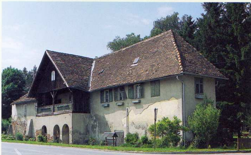
Louski dvorec, t.i. Jegerhaus, ob grajskem parku še čaka na primerno namembnost.