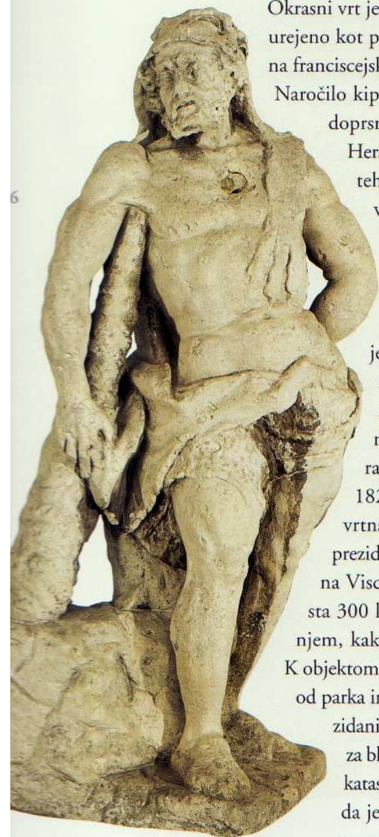
Heraklej je skupaj s Hermesom sooblikoval baročno podobo grajskega parka.

Okrasni vrt je bil tudi ob gradu, kjer je bilo, sodeč po Vischerju, vse vzhodno dvorišče urejeno kot partetni tip vrta. Takšen je ostal še daleč v 19. stoletje, kar je lepo vidno na franciscejskem katastru iz leta 1824.