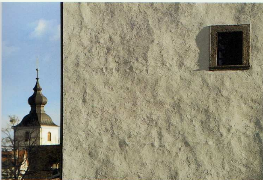
Graslov stolp, pozneje Attemsova kašča, nazadnje pa zadružni silos. Po daljši prenovi je Slovenska Bistrica leta 2004 pridobila izjemen razstavišni prostor.

Današnjemu enačenju stolpa v jugozahodnem vogalu mestnega obzidja z arhivsko sporočenim Graslovim stolpom je botrovalo zgodovino pisje 20. stoletja. Ta stolp se je prej imenoval tudi Smodniški in še ne daleč nazaj med domačini tudi Hungerturn in Reiseturn, ki pa ni dobil imena po rižu, ampak po nemški besedi Riesentturn (velik, ogromen stolp). Kakorkoli že, stolp je po prenovi oktobra 2004 odprl vrata razstavnim dejavnosti. S tem smo pridobili restavriran objekt in idealne razstavne prostore v treh etažah, prva razstava pa je bila posvečena bogatemu arhivu bistriške gosposčine iz let med 1587 in 1944, ki ga hrani Pokrajinski arhiv v Mariboru.