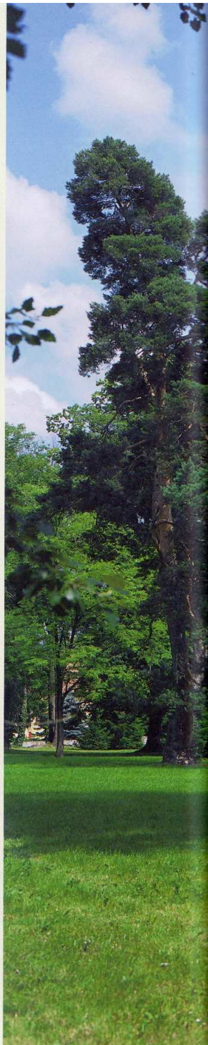
Angleški tip grajskega parka s še ohranjenimi eksotami.