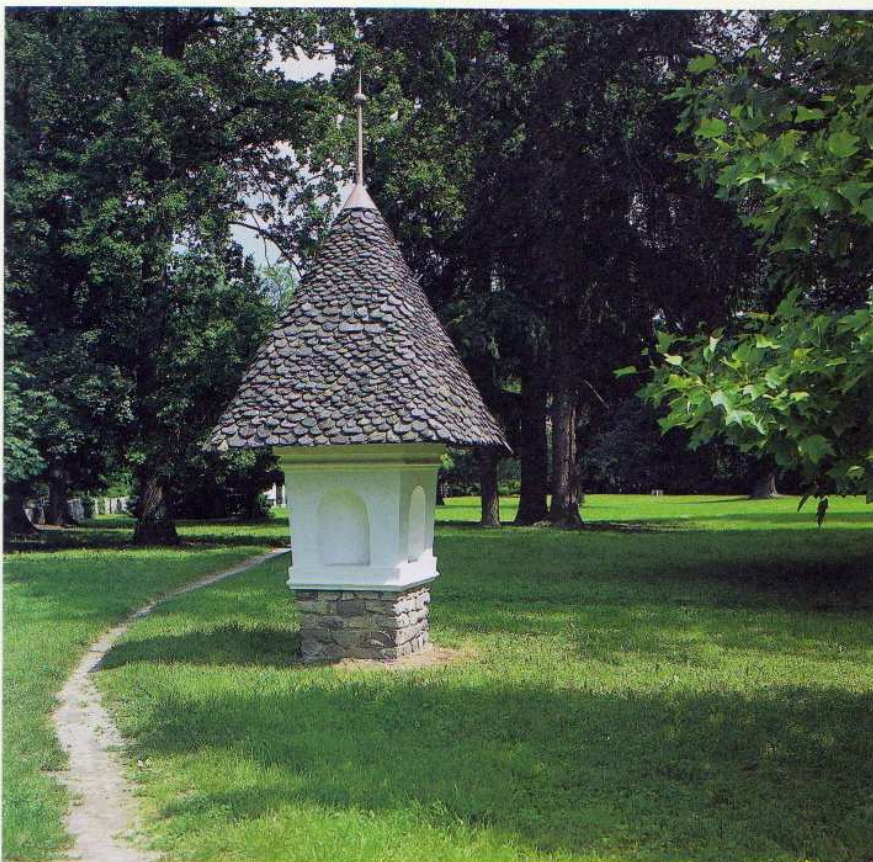
Slopasto znamenje je sprva stalo na samem in je bilo šele v drugi polovici 17. stoletja vključeno v razširjen grajski park.