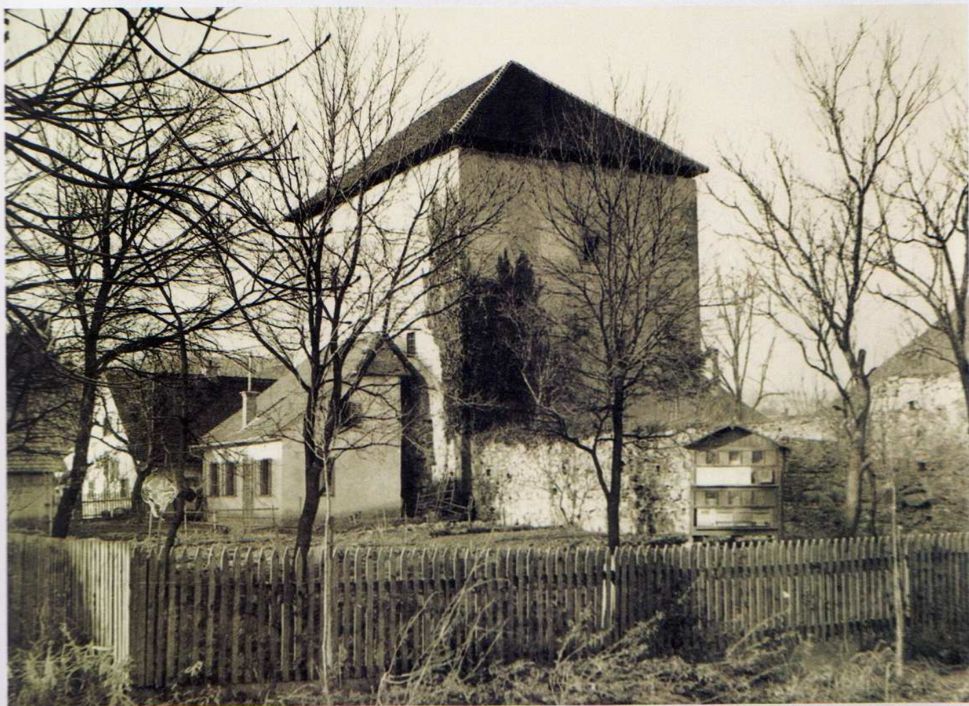
Graslov stolp v letih pred drugo svetovno vojno. Stavbi ob njem sta bili porušeni leta 1999.