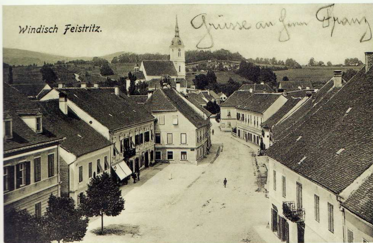
Slovenska Bistrica v letih pred prvo svetovno vojno. Pogled proti župnijski cerkvi sv. Jerneja.