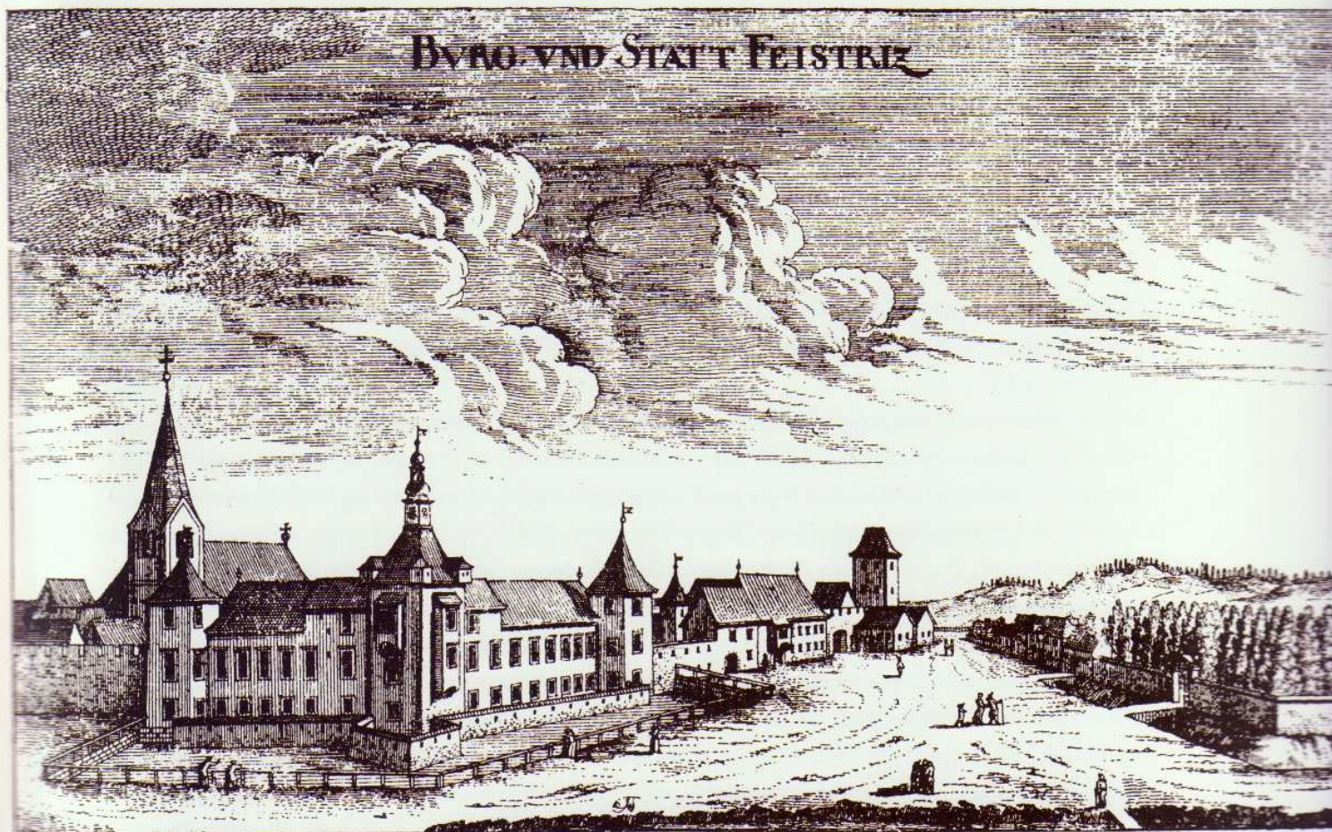
Zgovornejša upodobitev Slovenske Bistrice, na kateri je risar okrog leta 1681 prepričljivo razčlenil zahodno stranico mesta med gradom in Graslovim stolpom, na desni pa je viden grajski park. (Po G. M. Vischerju, 1681)

Ko Janoš Hunyadi ni mogel zavzeti Bistrice, je poslal še isto noč Szekelyja, sina svoje sestre, z oddelkom konjenikov proti Celju. Mogoče je bilo do tisoč konjenikov ...» (Po prevodu L. M. Golje, 1972).